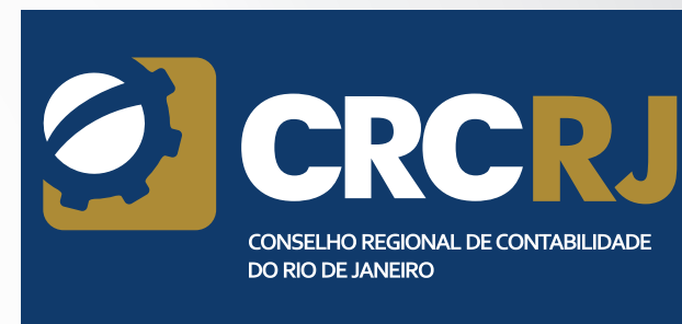
Fundo azul escuro