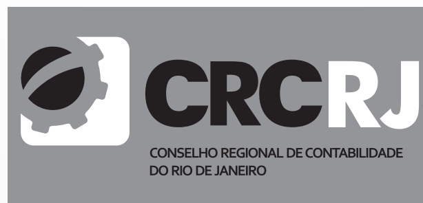
Fundo cinza claro