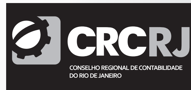
Fundo cinza escuro